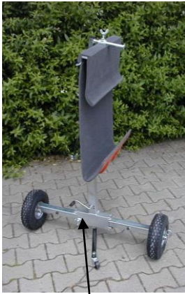
höhenverstellbar mit Kurbel