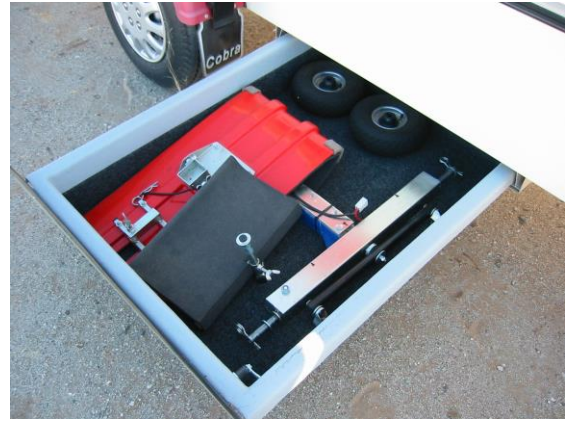
EMM in Schublade